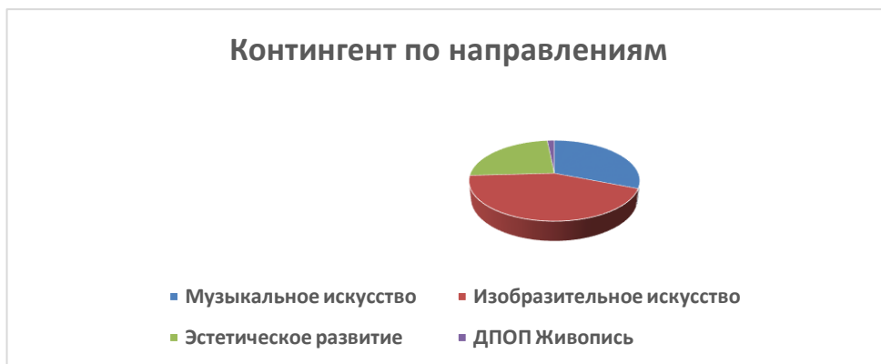
Таблица № 2